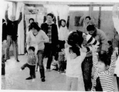
楽しそうにふれあう親子

また、親子が楽しめるユニークな歌や遊びをたくさん教えてもらい、最後は、ボランティアの皆さんが作ってくれたホッカホカの焼き芋をいただき、「楽しかったね」と顔を見合わせていました。