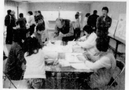
実験を楽しんでいます

化学を楽しく勉強しましょうと、池田町のラ・ヴィータ西宮自治会が2月14日、集会室で「なるほど環境理科実験」を開催しました。