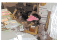
NPO法人シニアしごと創造塾 講師 斎藤一郎・太田克海